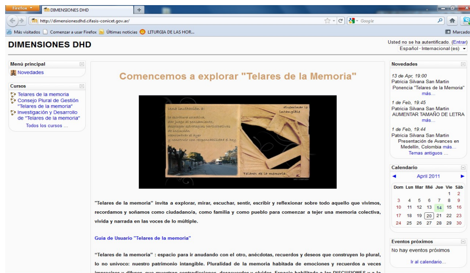
Fig. 1. Portal MOODLE Telares de la Memoria.

EL DHD “Telares de la memoria”, como sistema complejo, ( http://dimensionesdhd.cifasis-conicet.gov.ar ) se compone actualmente de dos subsistemas colaborativos y una presentación audiovisual. Los subsistemas son: el entorno colaborativo de código abierto MOODLE y el “Libro Hipertextual de la Memoria plural” (desarrollo ad hoc).